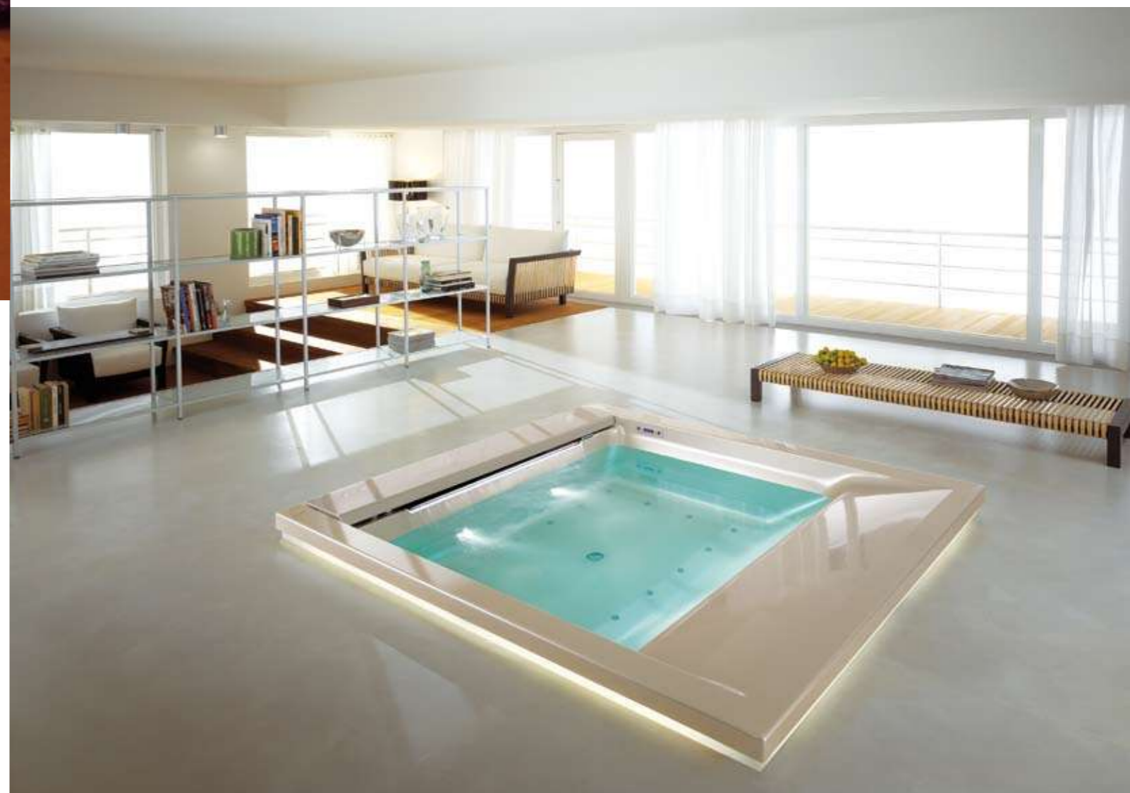
SeaSide_Vasca dotata di zona relax e funzionalità avanzate. Per Teuco Guzzini.

confortevole, moderna e interattiva, invece di essere una soluzione, diventa un problema. La domotica T-QUADRO permette tutto ciò. La nostra centralina è un prodotto molto evoluto che integra in un'unica piattaforma tutte le funzioni necessarie: una sintesi della filosofia T-Quadro.